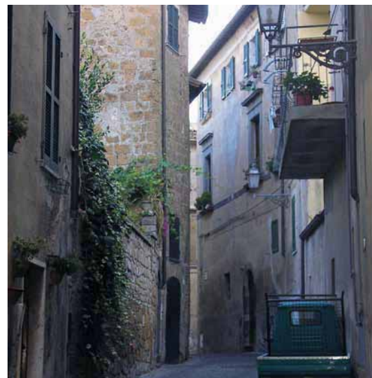
Til venstre: Amelia Midterst: Katedralen i Orvieto Til højre: Orvieto

omkransede middelalderbyer. Og Appenninernes højere bjerge, der tegner grænsen mod regionen Marche, rejser sig smukt i horisonten.